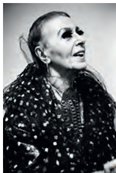
L'artista nella sua mostra allo Studio Marconi nel 1973

The artist in her exhibition at Studio Marconi in 1973